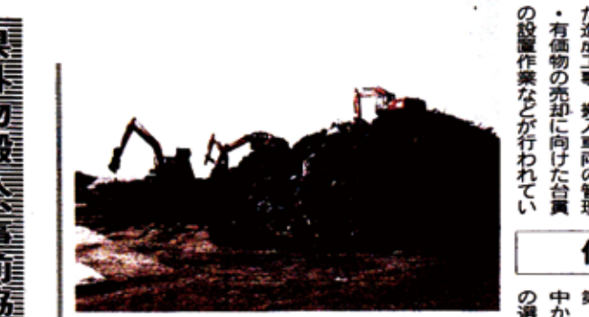
仙台市蒲生地区の仮置き場

仮置き場で準備が本格化 仙台市内の仮置き場で、災害廃棄物の処理や有価物の売却に向けた準備が本格化している。搬入量の増加にあわせて造成工事、搬入車両の管理・有価物の売却に向けた台員の設置作業などが行われている。 仙台市は、災害廃棄物を処理するために3カ所の仮置き場に仮設焼却炉を設置するが、現場では市の方針が決まり次第、積み上げられた廃棄物の管理や分別作業は、(財)宮城県産業廃棄物協会・仙台支部の立ち回りで進められている。蒲生地区はジャパンコンクリート、協栄組合仙台清掃公社、宮城衛生環境公社、荒浜地区は鈴木工業、大和工業、三浦組、井土地区は仙台環境開発サイコロアイフの各3社が中心と